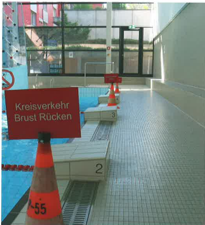
Um die Abstände besser einzuhalten, wurden die Schwimmer in Geroldswil klar unterteilt.

Die Schulen und der öffentliche Betrieb wurden ganz getrennt. Die Öffentlichkeit konnte statt um 8.00 Uhr erst um 12.00 schwimmen kommen. Dies wegen der begrenzten Besucherzahlen.