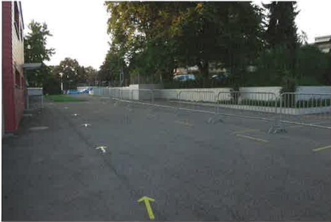
Eingang und Ausgang zum Kassenbereich in der Sportanlage Weihermatt.

Iris: Was konnte dank der Krise umgesetzt werden, wo man sonst zu wenig Zeit hat?