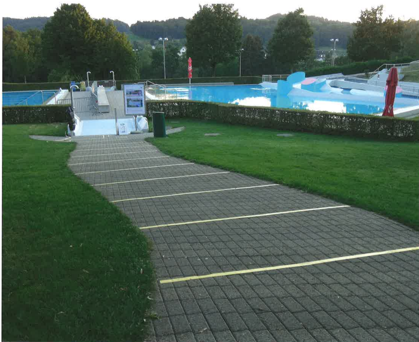
Abstandsmarkierungen zum Nichtschwimmerbecken im Weihermatt.

dem Rasen oder im Bad unterrichtet. Da nicht mehr als zwei Klassen auf einmal bei uns sein durften, musste auch dies bei der Planung berücksichtigt werden. Am Abend wurden die Wintergarderoben auch von den Vereinen genutzt. Es mussten im Zeitplan Lücken gefunden werden, und es musste genug Personal auf der Anlage sein, um diese zweimal am Tag zu reinigen und zu desinfizieren, damit die COVID-19-Richtlinien eingehalten werden konnten.