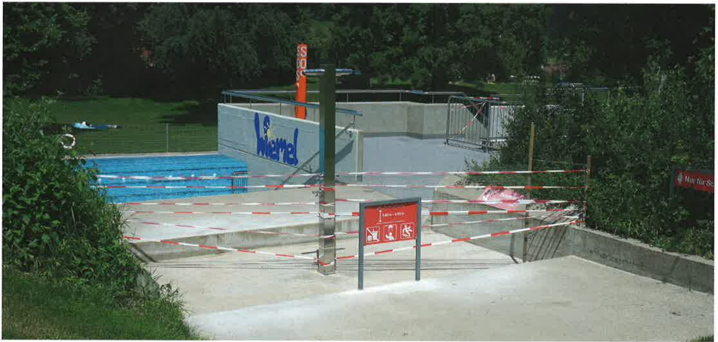
Dieser Eingang zum Sprungturm im Freibad Wiemel durfte nicht benutzt werden.

rungen zu den Becken zu halten, und fanden unzählige Möglichkeiten, die Abschränkungen zu umgehen. Diese wurden aber mit einem sofortigen Rauswurf bestraft.