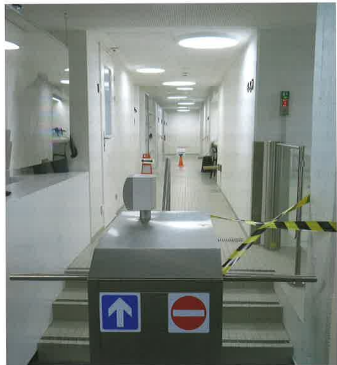
Einbahnbetrieb im Hallenbad Geroldswil.

Maya: Nein. Nur die BadmeisterInnen hatten eine Arbeit. Das Kassenpersonal und die SchwimmlehrerInnen erhielten den Lohn, hatten aber keine Arbeit.