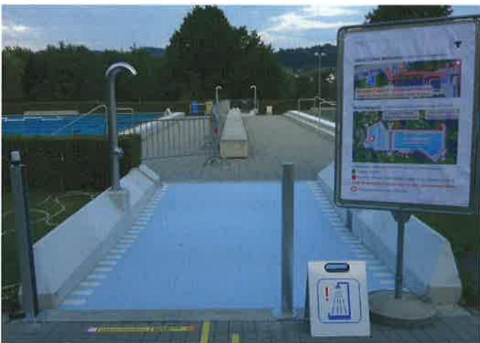
Elektronische Zutrittswächter zählten, wie viele Gäste sich im Nichtschwimmerbereich im Weihermatt aufhalten. War die Kapazität erreicht, leuchtete eine rote Lampe, und es gab einen akustischen Ton.

Shaban: Ich möchte meinen MitarbeiterInnen herzlich danken. Während der ganzen Revision war die Stimmung positiv, und jeder hat mitangepackt und flexibel gearbeitet. Auch wurden ohne ein negatives Wort Arbeiten ausgeführt, welche nicht im eigenen Funktionsbeschrieb stehen. Die MitarbeiterInnen machten ihr Möglichstes, um das Schutzkonzept umzusetzen, es war für alle nicht einfach, unter diesen Umständen die Badi-Saison erfolgreich zu bestreiten.