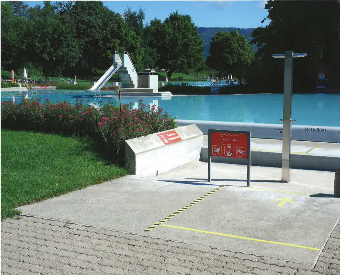
Zutritt zum Nichtschwimmerbecken im Wiemel Würenlos.

Iris: Hast du noch etwas Spezielles während dieser akuten Zeit erlebt und zu erzählen?