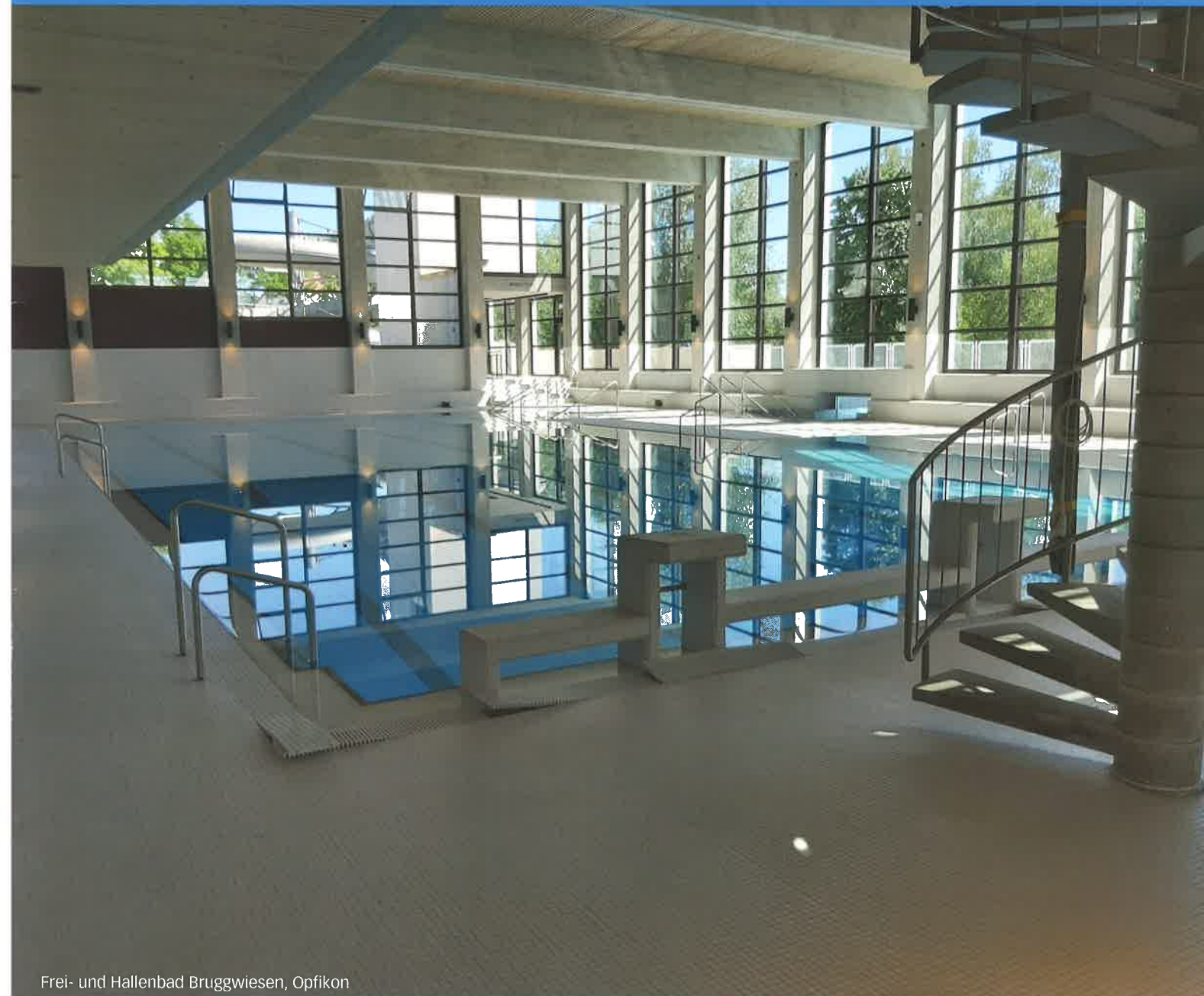
Frei- und Hallenbad Bruggwiesen, Opfikon