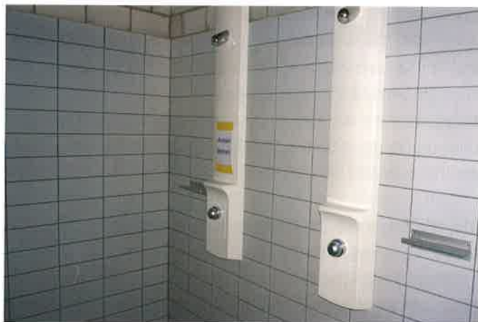
Nur eine Dusche durfte im Wiemel benutzt werden.

Simon: Es gab beim ersten Besuch viele Fragen, wie es nun laufe. Die Massnahmen wurden grösstenteils akzeptiert. Die Badegäste waren froh, dass sie wieder in die Badi kommen durften. Die Kinder hatten mehr Mühe, sich an die Absper-