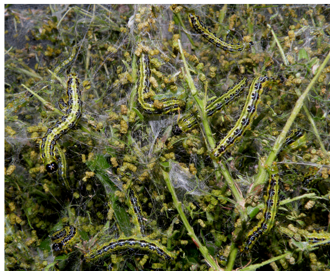
Das Foto links zeigt den Buchsbaumzünsler, einen Kleinschmetterling aus Ostasien, das Foto rechts einen Massenbefall durch ausgewachsene Larven, sichtbar sind auch die Gespinste und Kotkrümel der Larven.