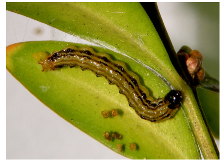
Frühe Anzeichen für einen Buchsbaumzünslerbefall von links nach rechts: Eigelege auf Buchsblatt, Frassspuren einer Jungraupe (zusätzlich sind bereits Gespinste sichtbar) und Jungraupe mit Kotkrümeln.

kapsel. In Längsrichtung hat sie zwei schwarze, weiss eingerahmte Streifen und weist in diesem Bereich schwarze Punkte auf. Auf diesen schwarzen Punkten wachsen feine weisse Haare. Die Puppen der Raupen kann man daran erkennen, dass sie rund zwei Zentimeter lang sind, eine dunkelgrüne Färbung aufweisen und ein schwarz-gelbes Muster an der Seite zeigen. Der Falter besitzt lange Fühler und weissliche bis graue Flügel, welche teilweise leicht rosa schimmern. Die Flügelränder sind dunkelgrün gefärbt. Allerdings kann der Falter kaum beobachtet werden, da er nur nachts aktiv ist.